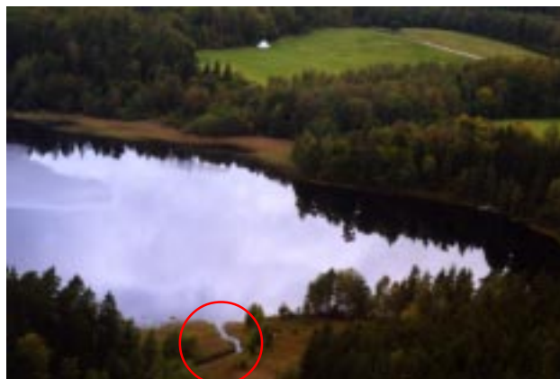
Den lilla Emmaljungaån i bildens underkant kan visa sig växa till en hel föroreningsflod om det vill sig riktigt illa. Men det hoppas vi förstås att det inte vill.