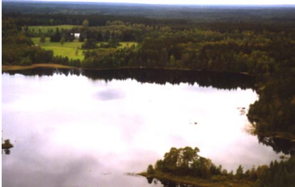
Här har limnologer, utrustade med vadarstövlar och vassbälten letat vasstrån och plockat näckrosor.